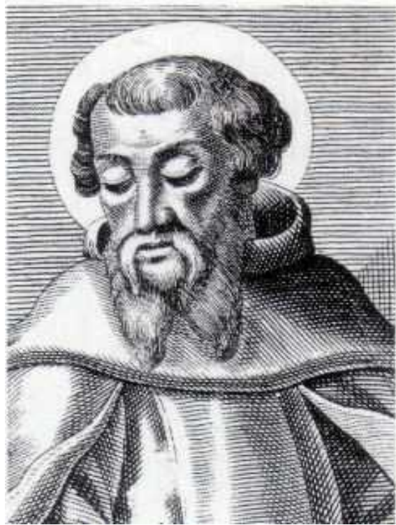
St. Irenaeus ( c. 130–202), an early Christian Premillennialist.

Tertullian (ca. 160 – ca. 220 A.D.) was a prolific early Christian author from Carthage in the Roman province of Africa